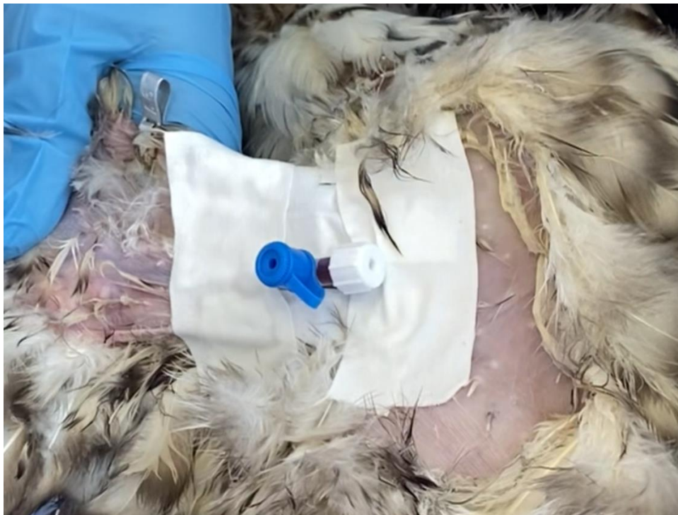
Рисунок 2 – Установленный периферический венозный катетер