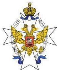
ФГБНУ «НИИ АГиР им. Д.О. Отта»