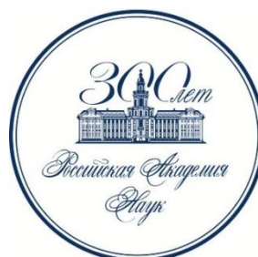
НС ОБН РАН

по биологическим (биоресурсным) коллекциям