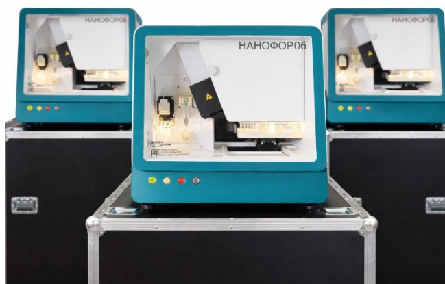
Генетический анализатор "Нанофор 06"