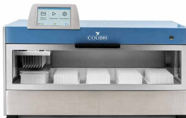
Прибор для автоматического выделения и очистки нуклеиновых кислот на магнитных частицах "COLIBRI"